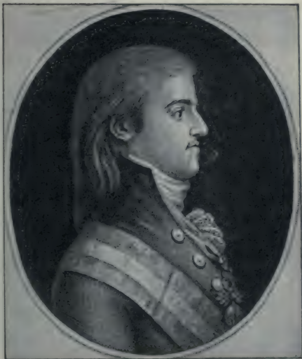
Ferdinand, prince des Asturies.